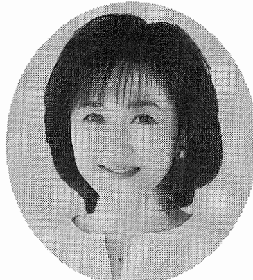
いなる あきこ 生稲あきこ 新・53歳

【経歴】バレーボール選手として活躍、元プロビーチバレー選手へ転向、北京・ロンドン両五輪出場、国土交通大臣政務官、党青年局長代理など