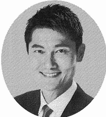
あさひ けんたろう 朝日健太郎 現1期・46歳

【経歴】バレーボール選手として活躍、元プロビーチバレー選手へ転向、北京・ロンドン両五輪出場、国土交通大臣政務官、党青年局長代理など